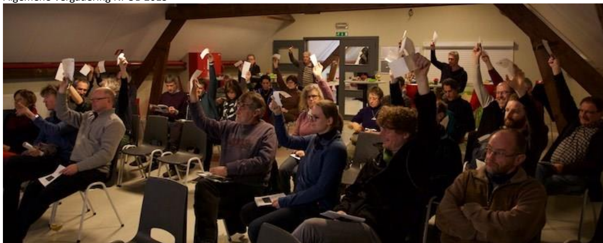
Algemene Vergadering NPOB 2015

De raad van bestuur zal zich telkenjare buigen over de voortgang van de meerjarennota en de omzetting in het jaarlijkse werkingsprogramma. Vervolgens zal dit ter bespreking en goedkeuring voorgelegd worden aan de Verenigingsraad in het najaar en de formele jaarlijkse Algemene Vergadering in het daaropvolgende voorjaar.