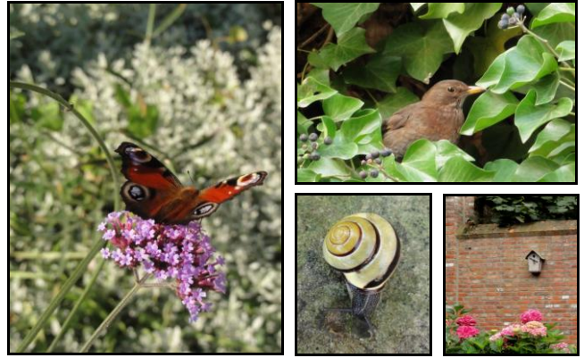
Ecologische tuinen vormen een dynamisch evenwicht.

Ecologische tuinen dragen het sterkst bij aan de stedelijke biodiversiteit. Maar een ecologische tuin is vooral ook een gezonde en evenwichtige tuin. Dit heeft enorme voordelen. Doorgaans komen er minder plagen voor aangezien elke soort in toom wordt gehouden door zijn of haar natuurlijke vijanden. Slakken vormen bvb. de maaltijd van de vogels die je naar je tuin aangetrokken hebt door de aanplant van struiken en bomen (of door het hangen van nestkastjes). De slakkenpopulatie krijgt dus geen vrij spel. Indien men verstandig omgaat met de ecologische principes, dan zijn deze tuinen ook zeer mooi. Het is dus zeker niet zo dat je er enkel een onverzorgde "stadsjungle" aan overhoudt.