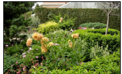
Tuinen bevatten vaak een mengeling van inheemse en uitheemse planten.

De soortenrijkdom in tuinen is soms verbazingwekkend hoog. Een studie in 19 tuinen in Vlaanderen leverde gemiddeld 160 plantensoorten op (incl. de cultuurvariëteiten) per tuin. In de steden - waar de tuinen veel kleiner zijn - ligt dit aantal meestal lager. Vanuit ecologisch standpunt moet natuurlijk een onderscheid gemaakt worden