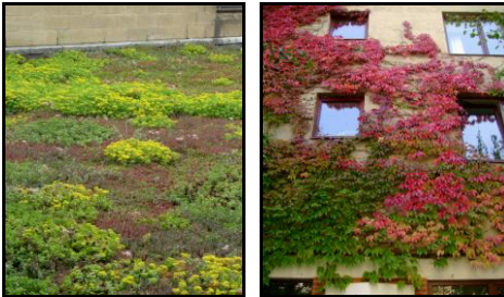
Ook kleinere (voor)tuinen, gevels en daken hebben een zekere natuurwaarde.

Een andere misvatting is dat je voor een ecologische tuin een grote tuin moet hebben (al is het wel zo dat de mogelijkheden daar uitgebreider zijn). Ook in kleinere tuinen zijn er nog heel wat voorzieningen mogelijk voor de fauna: nestkastjes, mussenpannen, insectenhôtels, waterelementen, takkenrillen, enz... Of wat dacht je van een eigen kunstnest voor gierzwaluwen. Voederplankjes in de winter zijn eveneens nuttig, maar men mag niet te lang blijven doorvoederen in het voorjaar. Tijdens strenge winters (én tijdens een hittegolf) kan je dieren een handje helpen bij hun zoektocht naar water. Breek geregeld ijslagen of voorzie een grote schotel met water in de zomer. Ijs moet je wel zéér voorzichtig breken, om onderwaterleven niet te storen.