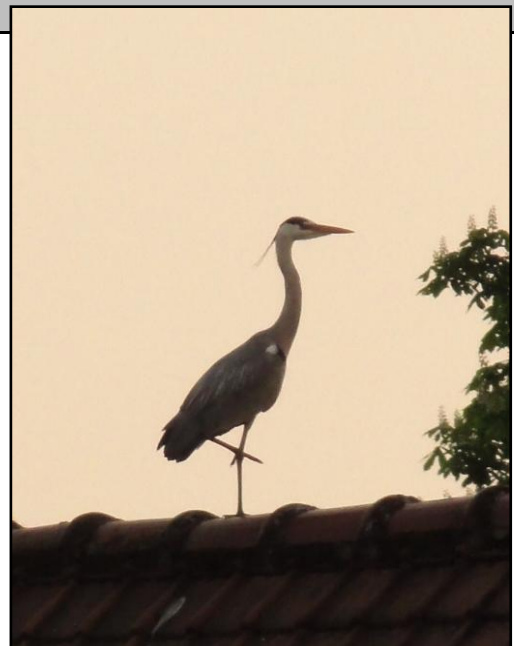
De Blauwe reiger durft zich ook in de binnenstad te vertonen (Tervuursevest).

De grootte en de opbouw van een park (m.a.w. aanwezigheid van diverse terreinelementen zoals (ecologische) graslandjes, hagen, oude bomen, water, enz... beïnvloeden sterk de soortenrijkdom. Maar ook het parkbeheer speelt een belangrijke rol. En de ene soort verdraagt verstoring beter dan de andere. Uit deze studie blijkt alleszins opnieuw het belang van voldoende gelaagdheid van de vegetatie in parken. Het verwijderen van dichte struikvegetaties en wildere hoekjes bevoordeelt slechts een beperkt aantal typische stadsvogels (de zgn. "urbanofielen") ten koste van andere en leidt dus tot een verlaging van de biodiversiteit.