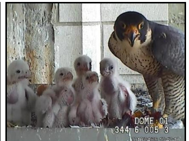
Links: Broedende slechtvalken (ROB-tv, 18 mei 2011). Rechts (2 foto's): natuureducatie m.b.v. webcambeelden (Brussel).