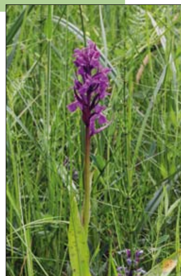
Brede orchis.