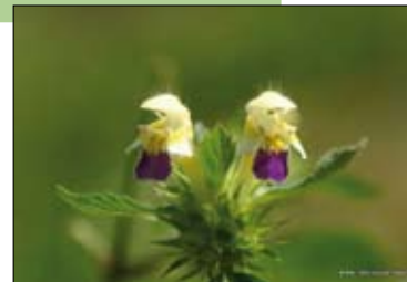
Haachts Broek, dauwnetel.

Info: www.natuurpunthaacht.be . Zie ook elders in dit tijdschrift, p. 18-19