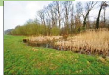
Heibos, Linter.