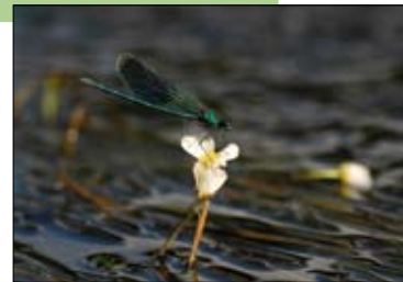
Weidebeekjuffer.