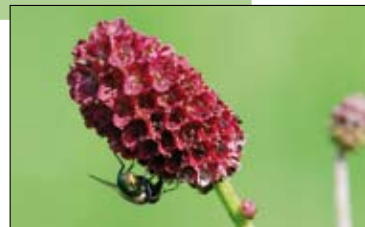
Grote pimpernel.

Info: Hans Marijns, 0473 73 03 10, info@natuurpuntboortmeerbeek.be