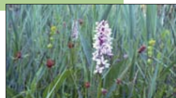
Orchideeënpracht in het Torfbroek.

Info: Jan Wouters, 02 361 15 97, torfbroek@scarlet.be