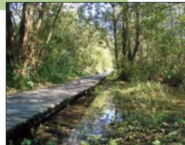
Natuur in Herent

Info: www.natuurpunt-herent.be of Lies.Natuurpuntherent@gmail.com