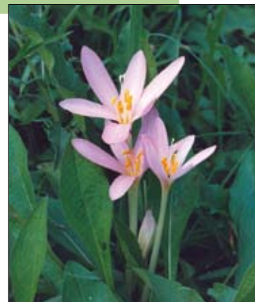
Herfsttijloos in Herent.

Info: Jos Vanden Eeden, 0498 77 43 13, jos.vanden.eede@pandora.be