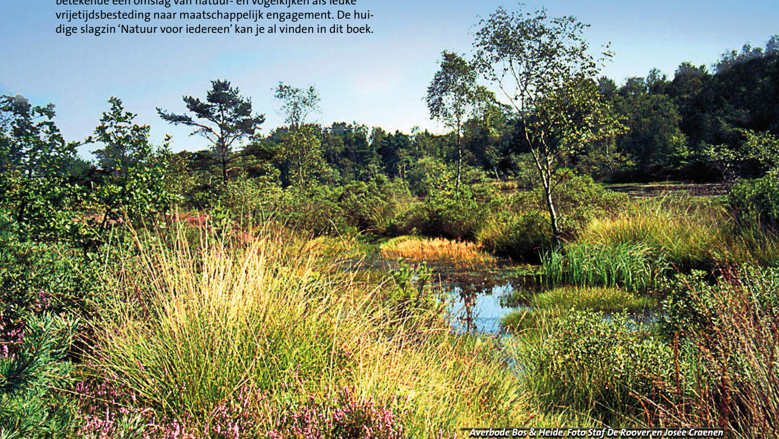
Averbode Bos & Heide.

Parallel hiermee werden naar aanleiding van nog maar eens een motorcross acties gevoerd voor de klassering van de Wijngaardberg. Hetzelfde gebeurde voor de Beningsberg in Wezemaal. Tot drie maal toe, ook hier nog in de pre-gewestplanperiode, werd deze Diestiaanheuvel op het laatste nippertje gered van ontzanding en verkaveling. Drie maal werd hij ook doorverkocht. Telkens werd tussengekomen bij de