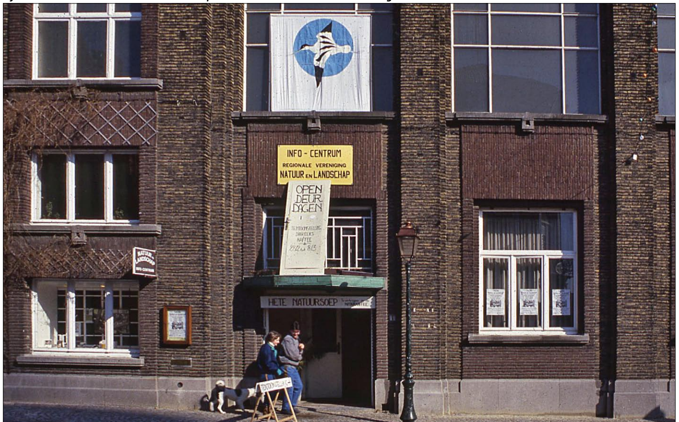
Infocentrum en secretariaat Natuur en Landschap in Tienen van 1980 tot 1996.