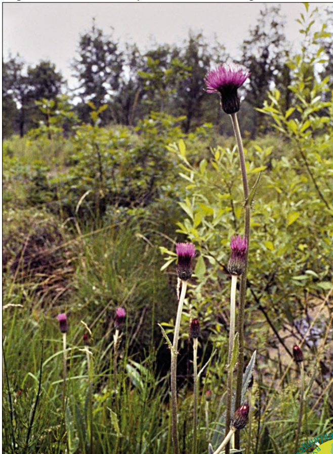
Langdonken met de zeldzame Spaanse ruiter.

Vlaamse Gemeenschap om hem als natuurreservaat te kopen, wat eindelijk gebeurde in het begin van de jaren '90. Zowel de Beningsberg als de Wijngaardberg zijn nu natuurreservaat. Even legendarisch was de actie rond het Walenbos, waar de toenmalige Nationale Landmaatschappij in de 60-iger jaren in navolging van hun ontginningsproject rond de Zegge in Geel gronden opkocht om het Walenboscomplex voor nieuwe boerderijvestigingen te ontginnen. Ook hier resulteerde de actie in een klassering als landschap. Nu is het Walenbos één van de grootste Vlaamse natuurreservaten. Minder succesvol verging het de Middelberg, de prachtigste Diestiaanheuvel met droge en natte heide, en het aangrenzend bos- en heidecomplex van Nieuwenhuyzen in Rotselaar, toen het biotoop van verschillende koppels nachtzwaluw en vele andere zeldzaamheden. De verkaveling van dit complex, waarvoor in maart 1975 de werken startten, kon de Regionale niet tegenhouden, wat leidde tot het huidige villapark. Dit gebied was op het gewestplan, dat inmiddels tot stand was gekomen, aangeduid als natuurgebied, maar er gold nog een oude verkavelingsver-