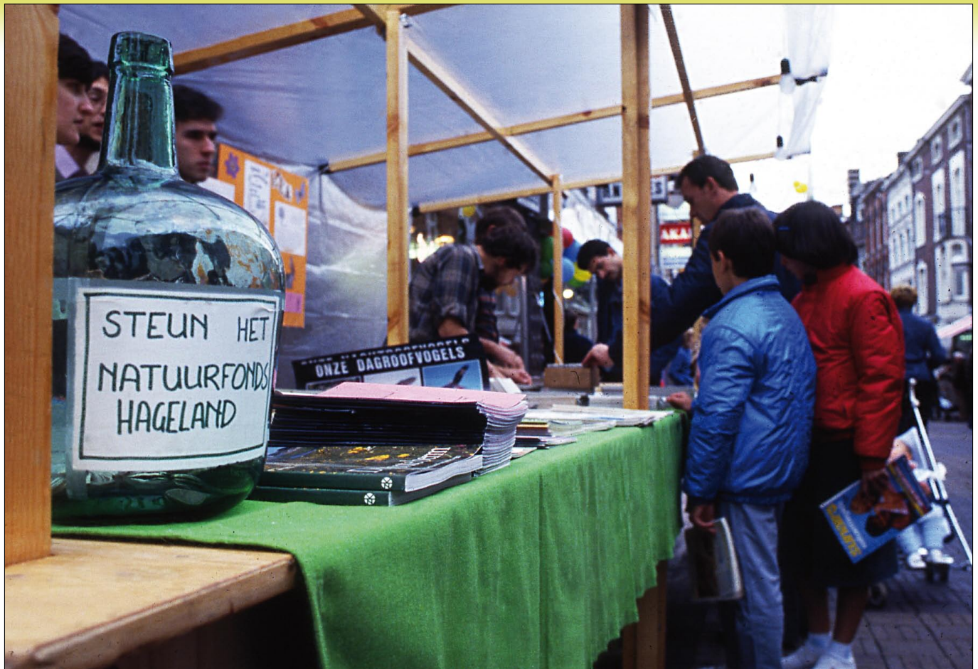
Waar de Regionale present tekende, zamelde ze middelen in voor het Natuurfonds Hageland. Hier in Tienen, 1986.

Tezelfdertijd werd ook actie gevoerd rond de Getevallei. Daar stonden klassieke wachtbekkens met veel beton gepland waar nu Doysbroek en de Getebossen gelegen zijn. In 1981 werd in Horst de Nationale Natuurbeschermingsdag georganiseerd met als thema 'Water voor natuur' en de strijd tegen de recht-trekking van Winge en Motte. Toen al ontwikkelde de Regionale de idee van 'integraal waterbeheer'. De vereniging stelde een bekenwerkgroep in, die later overgenomen werd door Natuurreservaten en die in heel Vlaanderen actief werd, en uiteindelijk resulteerde in het stopzetten van de beekrecht-trekkingen in Vlaanderen.