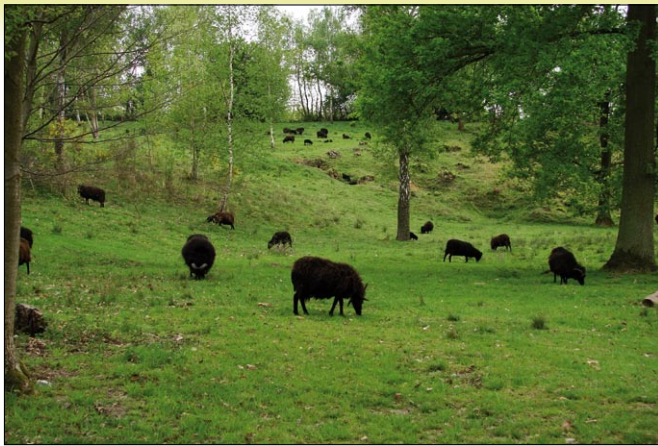
Wijngaardberg gered door de Regionale. Begrazing door Hebridenschape.

Vlaamse Gemeenschap om hem als natuurreservaat te kopen, wat eindelijk gebeurde in het begin van de jaren '90. Zowel de Beningsberg als de Wijngaardberg zijn nu natuurreservaat. Even legendarisch was de actie rond het Walenbos, waar de toenmalige Nationale Landmaatschappij in de 60-iger jaren in navolging van hun ontginningsproject rond de Zegge in Geel gronden opkocht om het Walenboscomplex voor nieuwe boerderijvestigingen te ontginnen. Ook hier resulteerde de actie in een klassering als landschap. Nu is het Walenbos één van de grootste Vlaamse natuurreservaten. Minder succesvol verging het de Middelberg, de prachtigste Diestiaanheuvel met droge en natte heide, en het aangrenzend bos- en heidecomplex van Nieuwenhuyzen in Rotselaar, toen het biotoop van verschillende koppels nachtzwaluw en vele andere zeldzaamheden. De verkaveling van dit complex, waarvoor in maart 1975 de werken startten, kon de Regionale niet tegenhouden, wat leidde tot het huidige villapark. Dit gebied was op het gewestplan, dat inmiddels tot stand was gekomen, aangeduid als natuurgebied, maar er gold nog een oude verkavelingsver-