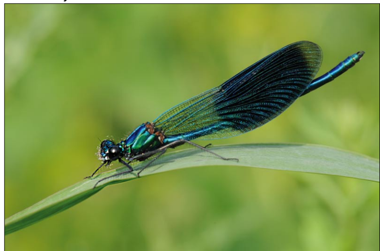
Koesterbuur 'avant la lettre': beekjuffer breidt uit in Rosdel.

volop ons beleid mee ondersteund, zowel het aankoop- als het projectenbeleid. Ook het Interreg-project heeft zijn vruchten afgeworpen.