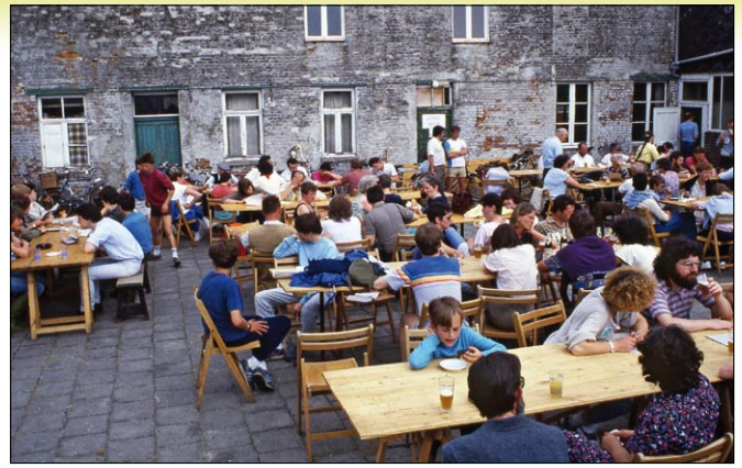
Velpeactie 1985. Uitblazen in Neervelp na de protestfietstocht tegen de rechtstrekking.

In die periode werd de belangrijke Velpe-actie op gang getrokken, die uiteindelijk de aanbestede en gegunde rechtstrekking en normalisering van de Velpe van Opvelp tot Halen met drooglegging van de volledige vallei tot een drainageklasse van 70 cm onder het maaiveld (nodig om grasland om te zetten